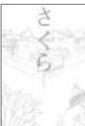
さくら 西 加奈子