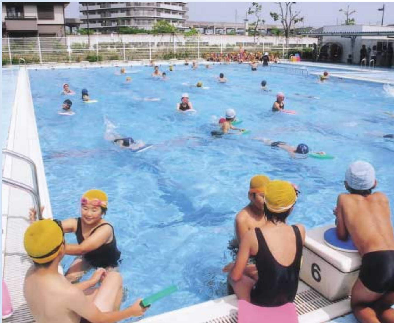
プールの授業風景（宇多津北小学校）