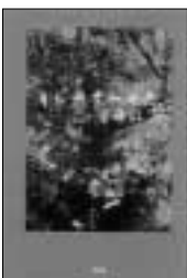
キジムナーの恋 本明 紅