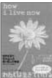
わたしは生きていく メグ・ローソフ