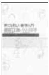
世にも美しい数学入門 藤原 正彦・小川 洋子