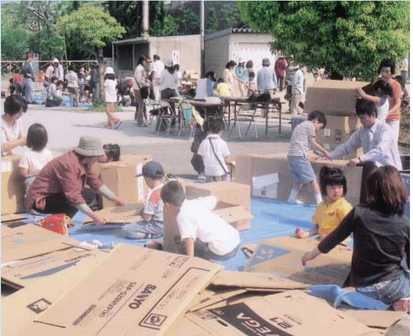
5月15日 子ども会わくわくイベント（北小）